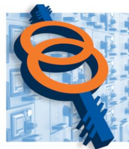
Комплектные трансформаторные подстанции 25-3200 кВА до 35 кВ