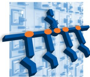
Распределительные щиты низкого напряжения до 3200А