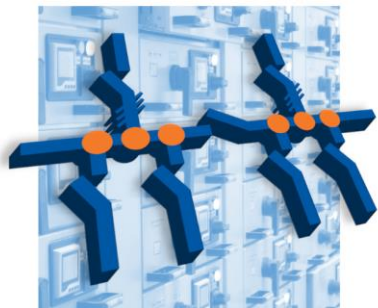
Главные распределительные щиты до 4000А