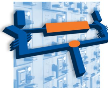
Устройства автоматического ввода резерва до 1600А