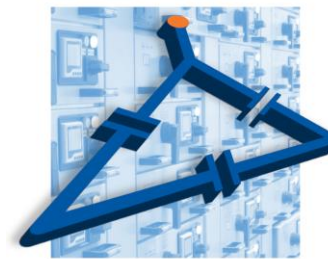
Устройства компенсации реактивной мощности 22-1150 кVar

А также щиты управления, автоматики и различные нетиповые решения любой степени сложности