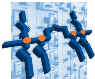
Щиты распределительные (сила/освещение) 16-630А